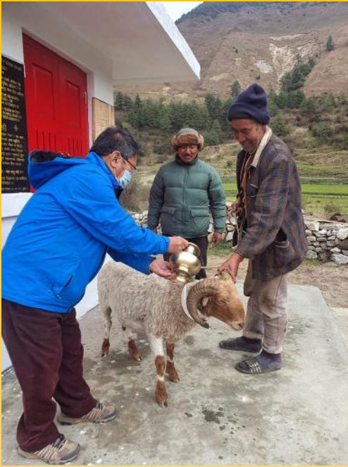
खिमी घर थमसेल, २०७८ वैशाख ११ गते