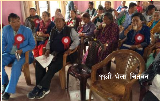
११औं भेला चितवन