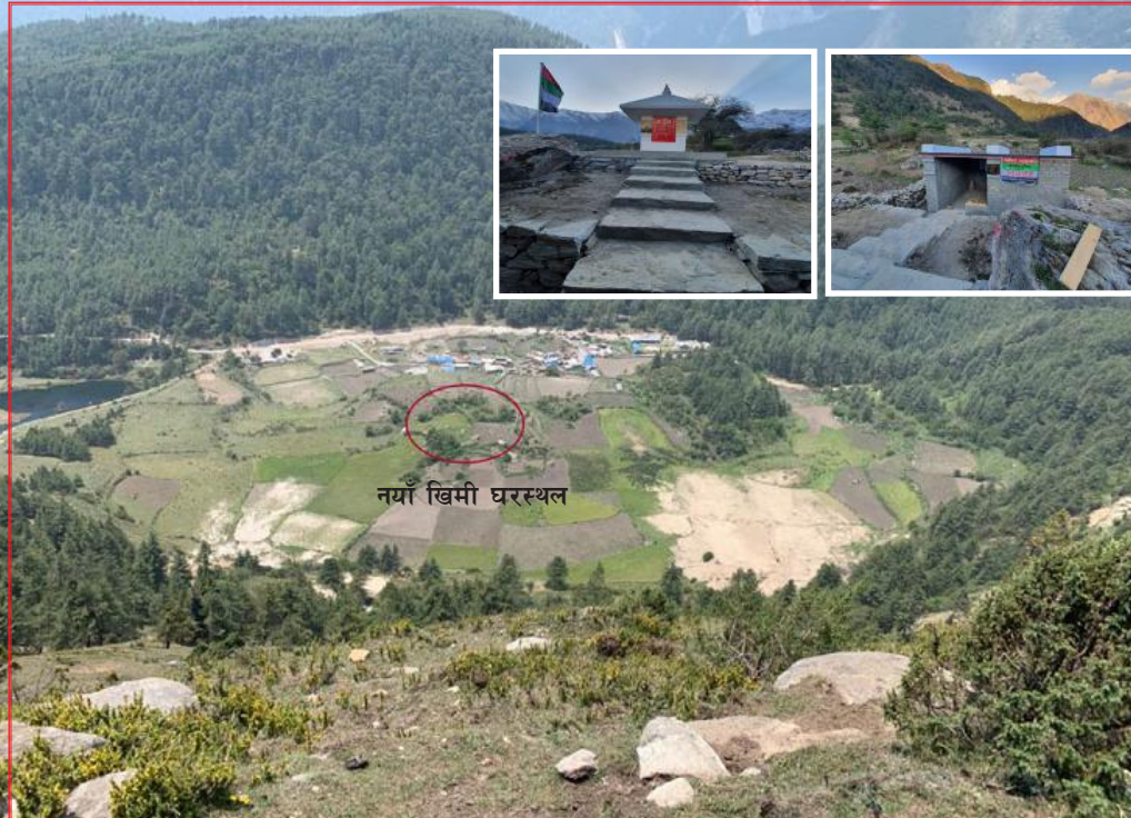
नयाँ खिमी घरस्थल