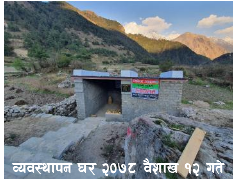
व्यवस्थापन घर २०७८ वैशाख १२ गते