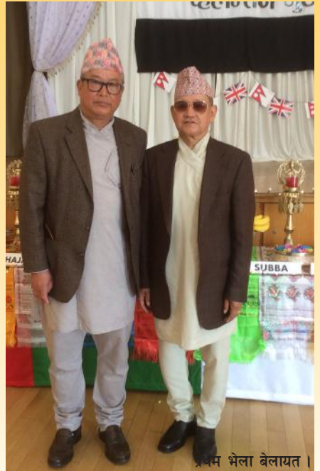
प्रथम भेला बेलायत ।