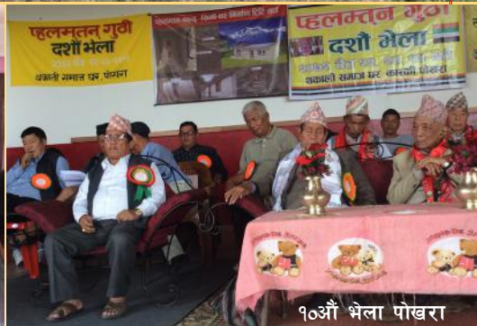
१०औं भेला पोखरा