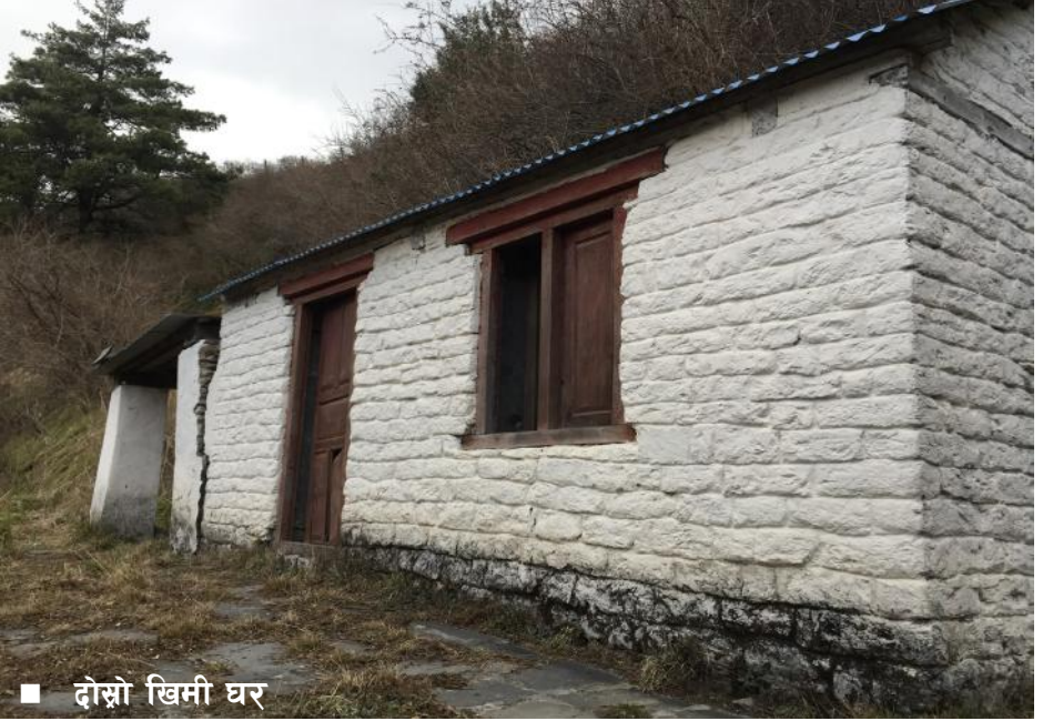
■ दोस्रो खिमी घर