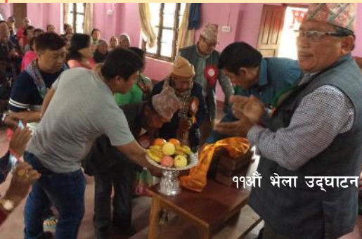
११औं भेला उद्घाटन