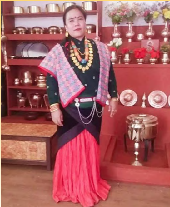
थकाली संस्कार तथा पैरन ।